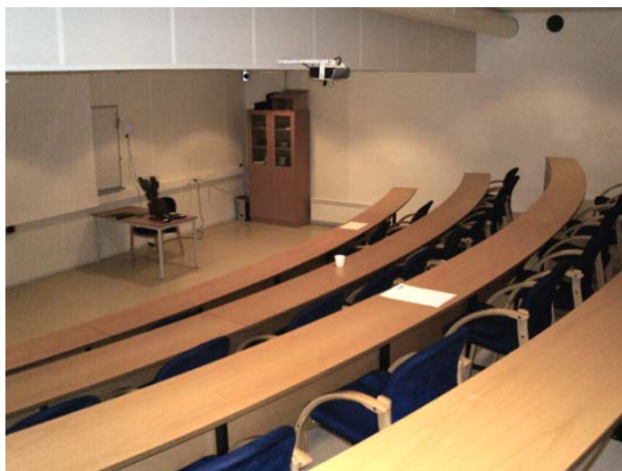
Auditoriet til Hareid Ressurssenter

Opplæringa er basert på 21 timar pr. veke med klasseundervisning, og 5 timar pr. veke med sjølvstudium.